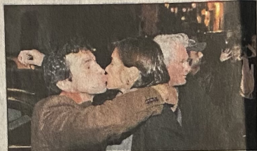
Carey Lowell a Trastevere saluta un suo amico californiano e, qui accanto, tenerezze sul red carpet tra Clooney e Canalis. A sinistra, Valeria Solarino e Isabella Ragonese e, a destra, la presa in giro del Trio Medusa