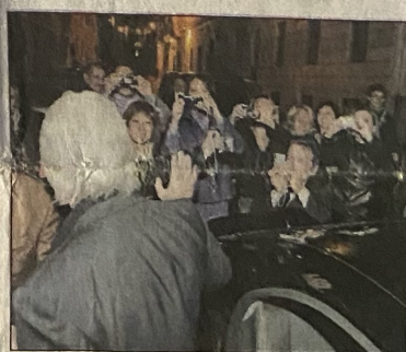
Richard Gere acclamato in via Garibaldi. A sinistra, il regista Jason Reitman. Sopra, George Clooney ed Elisabetta Canalis dopo la cena in via Mamelì