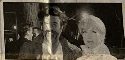
Roy De Vita e Nancy Brilli