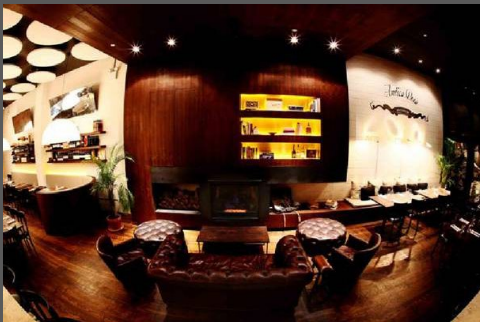
Antica Pesa Brooklyn